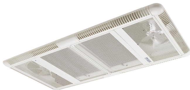
↑ montaż w podwieszanym suficie ↑