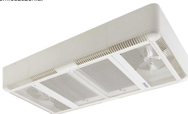
↑ mocowanie na suficie lub ścianie ↑

Model posiada dwa otwory dla wlotu świeżego powietrza z zewnątrz o średnicy 150 mm. Jeżeli te otwory są otwarte, wentylatory zasysają do 20% świeżego powietrza z zewnątrz, które następnie jest mieszane z oczyszczanym powietrzem z pomieszczenia.